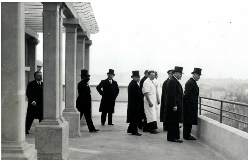
Inauguration de l'hôpital communal : le cortège sur la terrasse du 7 e étage 3 M 10, A.M.N.S.S.

En février 1928, le Conseil Municipal, adopte le projet de création d'un hôpital communal. La Ville acquiert deux terrains situés 34, puis 36, boulevard Bourdon. La première pierre est posée le 19 mai 1933 et l'édifice est inauguré deux ans plus tard, le 18 novembre 1935, par le maire Edmond Bloud, en présence du président de la République, Albert Lebrun.