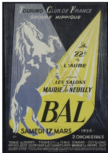
Affiche de Touring Club de France Groupe Hippique, dans les salons De l'Hôtel de Ville, 7 Fi 1193, A.M.N.S.S.