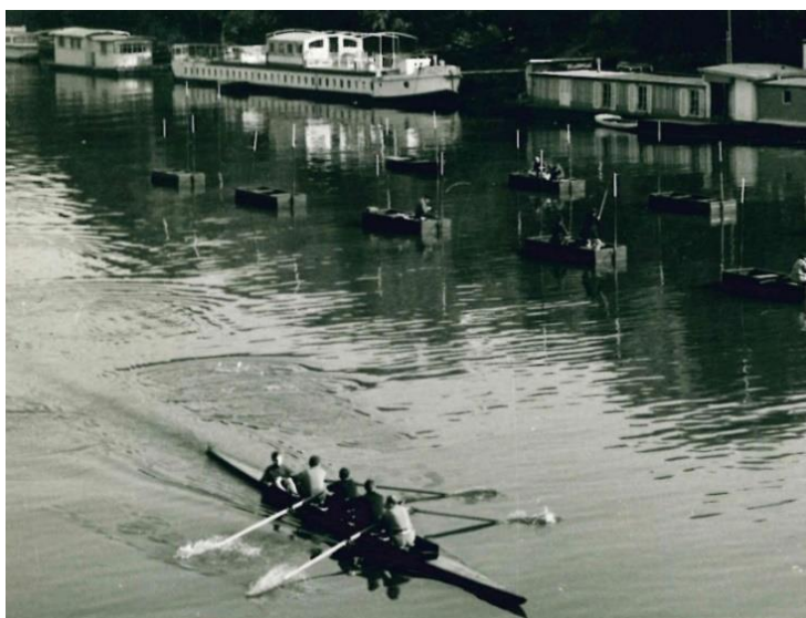
Un groupe sportif pratiquant l'aviron sur l'Île de la Jatte 5 F16.1, A.M.N.S.S.

Dès les années 1880, 400 à 800 personnes participent au sport nautique sur l'Île de la Jatte. Il fait partie d'un programme des festivités annoncées pour l'été : du 20 juin au 5 juillet. La Société d'Encouragement à l'Aviron installée depuis 1875 à Courbevoie est transférée au Complexe Sportif de l'Île du Pont de Neuilly en 1959, à la demande des membres de son Association. Cette dernière est persuadée que son transfert à Neuilly lui permettra de prospérer. Elle prend dès lors le nom du Cercle Nautique de France Universitaire. Ses attentes sont confirmées par plusieurs compétitions emportées notamment en 1982 où toutes les épreuves sont gagnées.