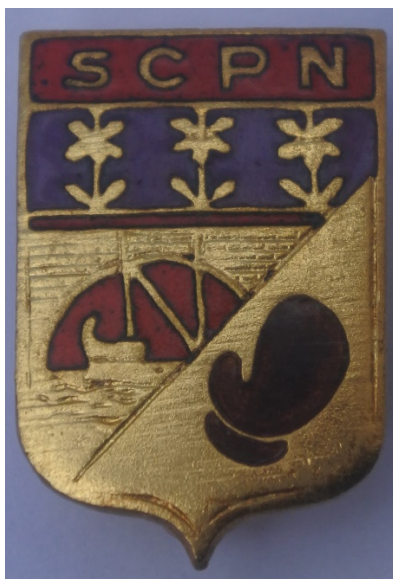
Insigne du Sporting Club Pugilistique de Neuilly, 1963, 345W1, A.M.N.S.S.

En 1951, « le club pugilistique de Neuilly » est créé grâce à l'aide de l'Office Municipal des Sports au 3, rue Paul Chatrousse. Peu à peu, le club prospère et gagne le championnat de France en 1963. A cette époque, il compte une vingtaine de boxeurs confirmés et la salle ne suffit plus pour les entraînements. En 1977, il gagne le Grand Prix de la ville de Paris.