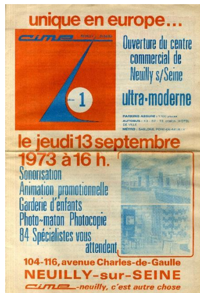
Brochure éditée à l'occasion de l'inauguration du marché couvert 1 C BROCH ASSO 1, A.M.N.S.S.

Dans les années 1950, la Ville décide de se doter d'un marché couvert. Réalisé sur un terrain situé à l'angle de l'avenue Charles de Gaulle et de la rue de l'Hôtel de ville, il est inauguré le 13 septembre 1973. Les locaux ne répondant plus aux besoins des commerçants et aux règles de sécurité, trois mois et demi de travaux sont entrepris en 1988. Les locaux rénovés sont inaugurés le 25 octobre 1988. Le marché couvert prend alors le nom de Carreau de Neuilly.