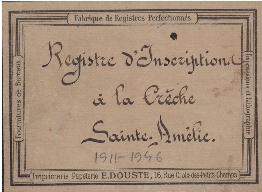
Registre d'inscription de la crèche 582V, A.M.N.S.S.

Par ailleurs, la commune aide régulièrement l'établissement à financer les travaux de réparation et d'entretien du bâtiment. La crèche perçoit également de manière régulière une subvention de l'Etat depuis le XIX e siècle et reçoit une subvention annuelle du département depuis au moins 1903.