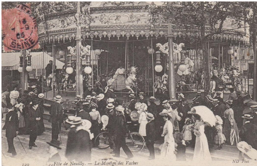
Le manège des vaches 2 Fi 3.61, A.M.N.S.S.

Les théâtres forains proposent des spectacles variés : marionnette, magie, automate, pantomime, cinématographie, pièces comiques ou dramatiques. Les musées se répartissent en trois catégories : anatomiques, ceux de cire et enfin les musées vivants qui proposent une reproduction réelle d'œuvres peintes ou sculptées. Le Grand musée Buiron expose par exemple en 1895 des sujets en cire sur le thème des « hommes illustres et femmes célèbres ». Les exhibitions de personnes hors normes connaissent un important succès, telle la présentation de la « belle Auvergnate » mesurant 1,90 m et pesant 295 kg ou encore de la jeune fille de 15 ans avec 3 jambes.