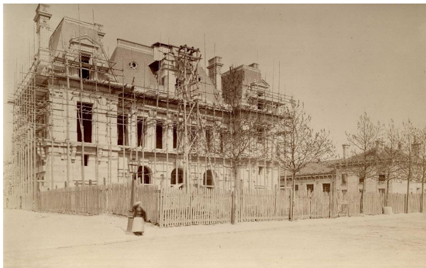
L'hôtel de ville en construction A.M.N.S.S.

Un concours est lancé en septembre 1879. 62 projets sont remis et exposés du 5 au 19 février 1880 au Palais de l'Industrie. L'architecte lyonnais Gaspard André est lauréat du concours. Cependant, il se désiste peu de temps après, les travaux de réfection du théâtre des Célestins à Lyon ne lui permettant pas de gérer ce nouveau projet. La construction est donc confiée à l'architecte Victor Dutocq, classé 3 ème du concours, qui s'associe à Charles Simonet, architecte plus expérimenté, arrivé 4 ème .