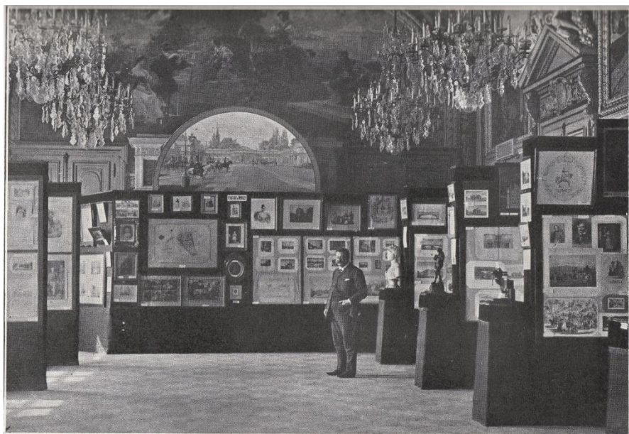
VUE DES SALLES DE L'EXPOSITION RETROSPECTIVE (Côté Ouest)

L'exposition est inaugurée le 11 mai 1907 et dure jusqu'au 26 mai. Elle est organisée dans la salle des fêtes de l'Hôtel de