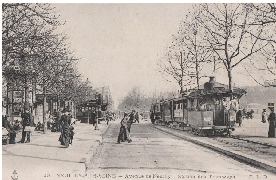
La station de tramway avenue Charles de Gaulle

Créé au début du XIX e siècle, le tramway est valorisé en France après la guerre de 1870. Un décret de 1873 confie l'exploitation des tramways en banlieue parisienne à deux sociétés : les tramways Nord sont alors gérés par la Compagnie des Chemins de Fers parisiens. La ligne 1 devenue par la suite ligne A est ouverte le 3 septembre 1874 : elle relie le pont de Neuilly à la place de l'Etoile, traversant ainsi Neuilly de part en part. Elle dessert alors l'axe le plus important de la commune et le plus fréquenté. Une seconde ligne est ouverte en 1875 reliant l'île de la Jatte à l'église de la Madeleine à Paris en parcourant le boulevard Bineau.