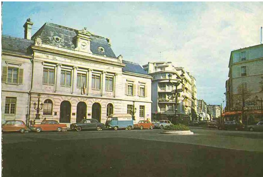
Bibliothèque municipale place Parmentier 2 Fi 12.30, A.M.N.S.S.

Une annexe est créée près du marché, rue Windsor. Le 19 février 1957, la première discothèque municipale de prêt en France est inaugurée à Neuilly dans les locaux de la bibliothèque municipale place Parmentier. En 1962 une deuxième bibliothèque annexe ouvre ses portes aux usagers boulevard du Château.