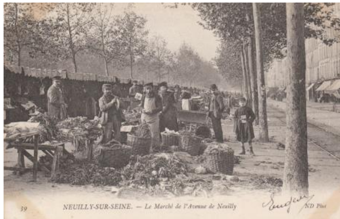
Le marché de l'avenue de Neuilly, Archives municipales de Neuilly sur Seine

Des marchés ont lieu toute la semaine : le mardi, le vendredi et le dimanche à Sablonville et à Saint James, le mercredi sur l'avenue du Roule, le samedi et le lundi sur l'avenue de Neuilly, le jeudi sur l'Ile de la Jatte. Par la suite, les jours d'ouverture changent. A Sablonville, Windsor et sur l'Ile de la Jatte, ils sont remplacés par le mercredi, le vendredi et le dimanche. Le jeudi devient un jour sans marché. En 1936, un projet prévoit la fermeture de tous les marchés le lundi à l'instar des commerçants. Malgré de fortes protestations, il aboutit.