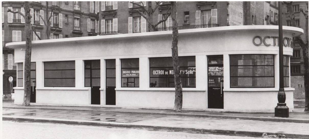
Bureau du Pont, situé 221 avenue de Neuilly, construit en 1938

Les bureaux d'octroi font l'objet d'attentions particulières : plusieurs d'entre eux sont réaménagés, déplacés ou remplacés. Par exemple, le bureau du Pont de Neuilly est reconstruit en 1909 pour cause d'insalubrité par l'architecte Léopold Girauld ; puis en 1938, un nouveau bâtiment est réalisé dans un style moderne ayant comme caractéristique innovante une enseigne lumineuse verte.