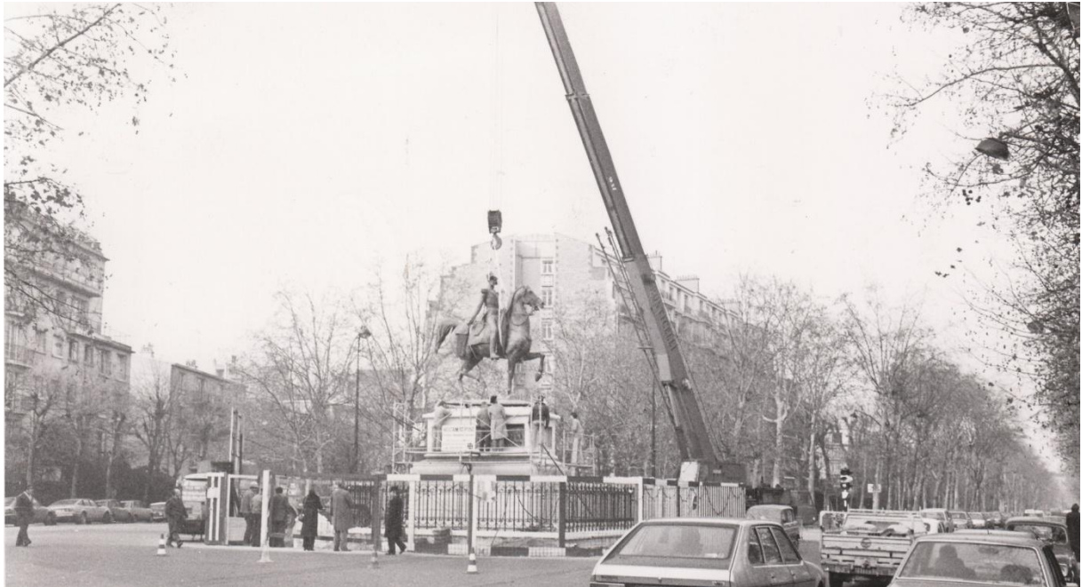
Installation de la statue du Duc d'Orléans en 1981, A.M.N.S.S.

Neuilly. L'organisation se fait en étroite collaboration avec l'association culturelle portugaise qui fête alors ses 20 ans d'existence. L'événement met en relief les liens entre le Portugal et la France.