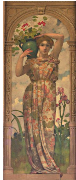
L'horticulture, peinture de P. Buffet (1908) Cliché A.M.N.S.S.

L'une de ces figures symbolise l'horticulture. Au XIX e siècle, de nombreux horticulteurs sont installés dans la ville : ils sont plus d'une vingtaine dans les années 1880-1900. Une Société d'Horticulture est créée en 1880 au 20, rue des Huissiers. Elle organise dès l'année de sa création puis tous les deux ans une exposition horticole au cours de laquelle des récompenses sont attribuées. Elle propose aussi d'autres concours : par exemple, bouquets et fleurs coupées chaque année ou jardins en 1903. Par ailleurs, en 1901, des cours d'horticulture sont mis en place à Neuilly-sur-Seine, selon la volonté du ministre de l'Agriculture : Léopold Vannel, horticulteur à Clamart, anime durant l'année 15 conférences et 6 applications pratiques. L'organisation de ces cours qui rencontrent un vif succès est renouvelée au moins pendant deux ans.