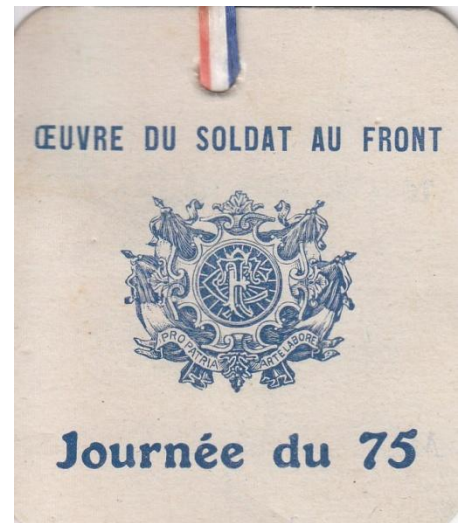
Carte d'identité des vendeurs 4H65, A.M.N.S.S.

Avec l'argent obtenu, l'œuvre expédie sur le front des paquetages contenant des vêtements et des produits d'hygiène. Elle envoie également des objets utiles tels que lampes ou jumelles, des denrées alimentaires comme le chocolat, le sel ou bien la moutarde, ainsi que tout le nécessaire pour fumer. Dans le but de distraire les soldats, elle leur fait parvenir toutes sortes de jeux (cartes, dominos, dames), de la lecture ou encore des ballons de football.