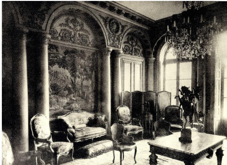
Grand salon avec le décor créé en 1822 par l'architecte Fontaine A.M.N.S.S., Cote 2 Z 354

Un album photographique du château est alors réalisé. Il permet de voir l'ameublement et le décor des pièces principales de la maison. Le vestibule péristyle et le grand salon ont conservé leur décor d'origine à la différence de la salle-à-manger qui est pourvue d'une cheminée néo-Renaissance aux armes des nouveaux propriétaires.