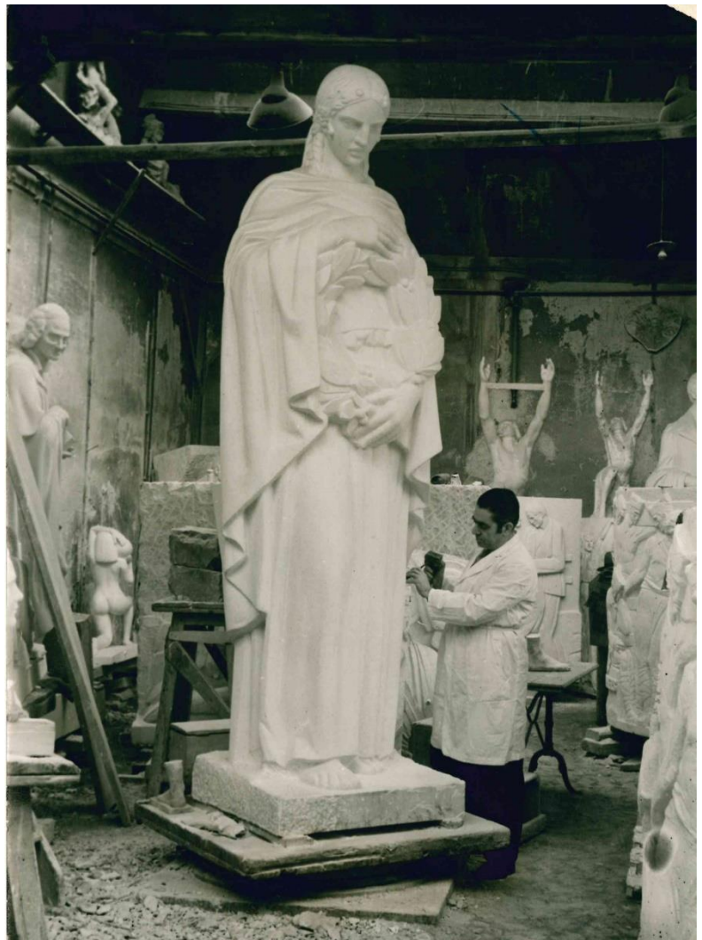
Statue « L'immortalité » dans l'atelier de Raymond Servian 1290R, A.M.N.S.S.

Sa construction est due à l'architecte Louis Jean Lefort, au sculpteur Raymond Servian et à l'entrepreneur Zanini. Il se compose de deux colonnes de 3,30 mètres de hauteur en roche d'Euville, situées au sein de vasques octogonales reliées par une stèle où est gravée l'inscription commémorative. Celle-ci est finalement dédiée aux policiers morts durant les deux guerres mondiales. Deux statues en marbre blanc de Carrare sont adossées aux colonnes et se font face : l'une représente le Droit sous la forme d'un guerrier armé d'un glaive et l'autre l'Immortalité sous les traits d'une femme