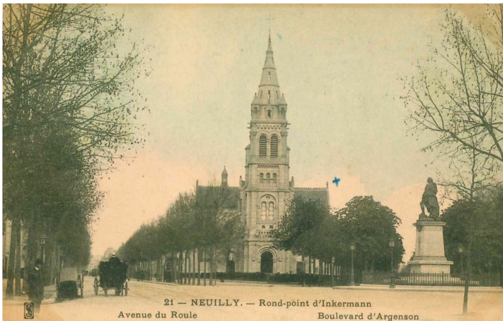
La place vers 1900

Le dimanche 4 juillet 1897, une statue à l'effigie de Jean-Rodolphe Perronet, réalisée par le sculpteur neuilléen Adrien Gaudet, est inaugurée au centre de la place. La statue mesure 3,30 mètres de haut et repose sur un socle de 4,50 mètres exécuté par l'architecte de la Ville Edouard Augustin Guiard. Cette statue est fondue durant la seconde guerre mondiale afin d'utiliser le bronze comme matière première pour le matériel de guerre.