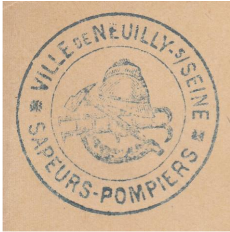
Tampon de la Compagnie des sapeurs-pompiers de Neuilly 1 M 125, A.M.N.S.S.

du 10 novembre 1903. La version définitive de l'arrêté règlementant le service des sapeurs-pompiers est approuvée le 24 mars 1910.