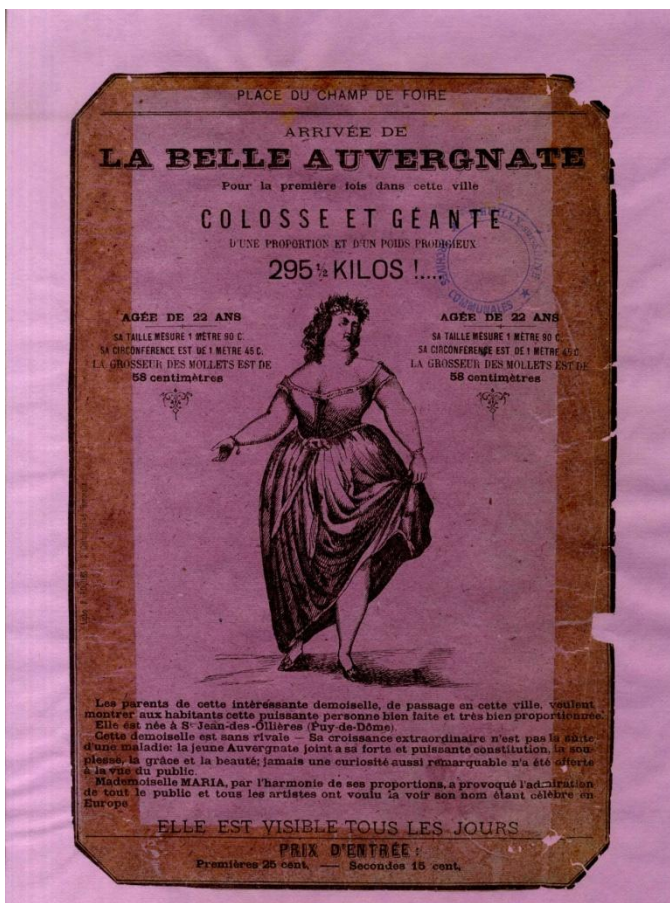
Tract « la belle Auvergnate », restauré en 2008 : dépoussiérage, mise à plat, décollage des renforts et adhésifs, teinture du papier de restauration, consolidation par doublage en plein 631V, A.M.N.S.S.

Il convient ensuite de réparer les déchirures et de combler les lacunes comme pour la liste des forains de 1922. Les déchirures sont consolidées par des doublages localisés. Les lacunes, c'est-à-dire les parties manquantes du document, sont comblées. Des papiers japon sont utilisés lors de ces deux opérations, les plus fins servant à la consolidation et les plus épais au comblage.