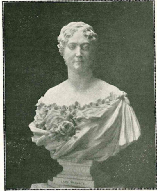
Sir Richard Wallace et lady Wallace.