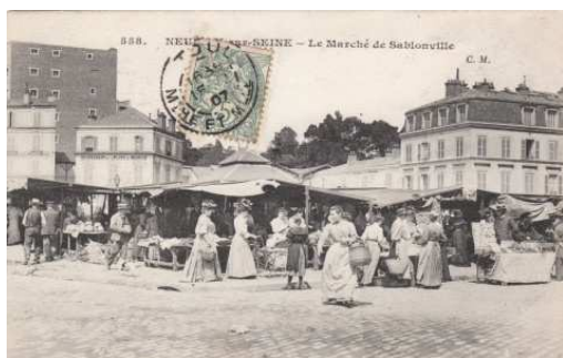
Le marché de Sablonville

En 1889, il existe également deux autres marchés : l'un situé sur l'avenue de Neuilly, entre l'avenue de Madrid et la rue des Gravières, l'autre sur l'avenue du Roule, entre la rue de l'Église et la rue de l'Hôtel de Ville. La concession des deux marchés est détenue par Auguste