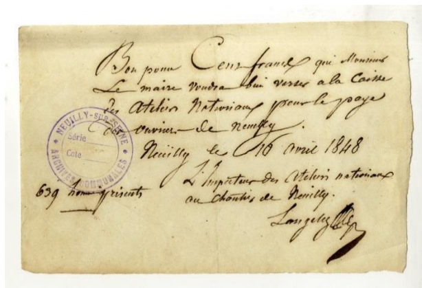
Bon de de 100 francs pour le paiement des ouvriers Cote 86 V - A.M.N.S.S.

Le 8 avril 1848, le maire de Neuilly crée son propre atelier national, affecté à la route nationale 13. Des ouvriers sont alors employés dans cinq compagnies, soit à l'atelier d'extraction de cailloux du bois de Boulogne, soit à celui des Ternes.