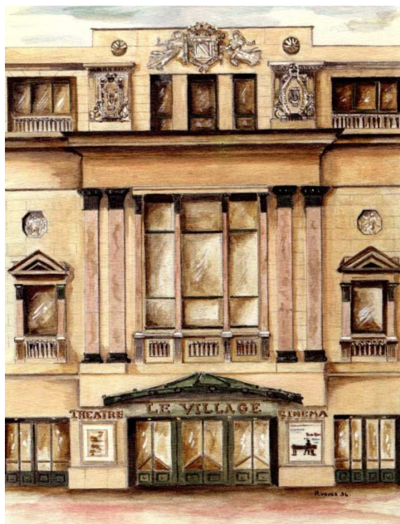
Cinéma-Théâtre Le Village (1994)

Entre 1906 et 1908, il a conçu un des bureaux d'octroi de la ville (situé à l'angle des boulevards Bourdon et Victor Hugo) ainsi que plusieurs immeubles et maisons particulières.