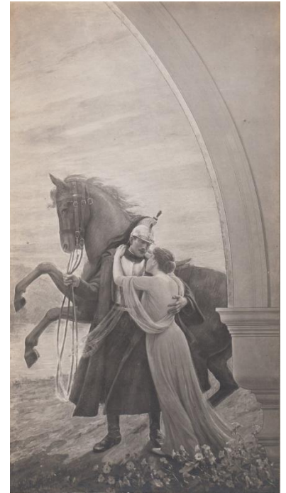
La jeunesse , œuvre d'Albert Aublet, installée en 1913 dans la salle des mariages et retirée en 1957 A.M.N.S.S. 1 M 36

A partir de 1910, la salle des Mariages est ornée des premiers tableaux prévus dès 1902. L'exécution de la peinture du plafond est ralentie par le décès d'Edouard Dubuffe, qui est alors remplacé par François Schommer pour la réalisation de La Patrie . Cette décoration picturale est modifiée en 1939 afin d'accueillir des œuvres du célèbre peintre Gustave Louis Jaulmes, et en 1957 celles du peintre néo-cubiste Camille Hilaire. Elle est la représentation symbolique du mariage et de la famille, doublée d'allégories citoyennes et d'éléments neuilléens.