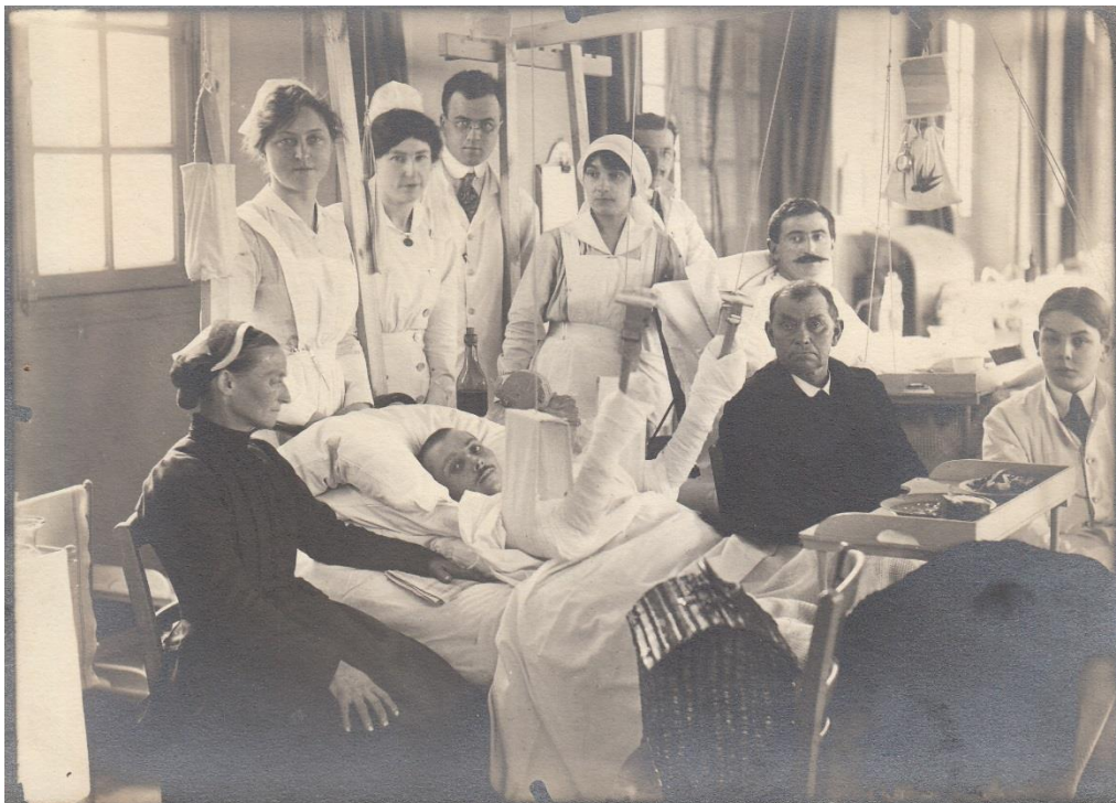
Infirmiers et infirmières entourent des patients et leurs familles 22 14, A.M.N.S.S.

L'ambulance et son service automobile sont financés par la générosité américaine. En effet, plusieurs appels aux dons sont lancés aux Etats-Unis : particuliers, municipalités et états y répondent. Le personnel est composé uniquement de volontaires américains. D'éminents médecins et spécialistes sont engagés. Beaucoup d'infirmières, pourtant moins bien payées que dans leurs pays d'origine, se présentent pour y travailler tandis que de nombreux bénévoles offrent leur service.