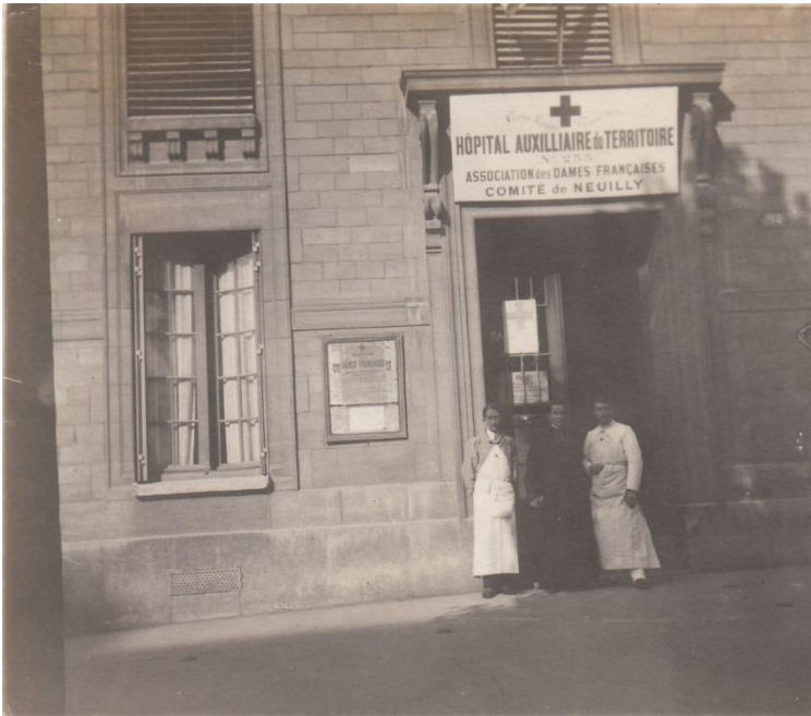
Hôpital auxiliaire n° 233 : Association des Dames Françaises installée dans l'actuelle école Achille Peretti 2 Fi 6.3.7, A.M.N.S.S.

16 hôpitaux sont ainsi créés à Neuilly. La plupart ouvrent leurs portes en 1914 ou 1915 et ferment à la fin de la guerre en 1918 ou 1919.