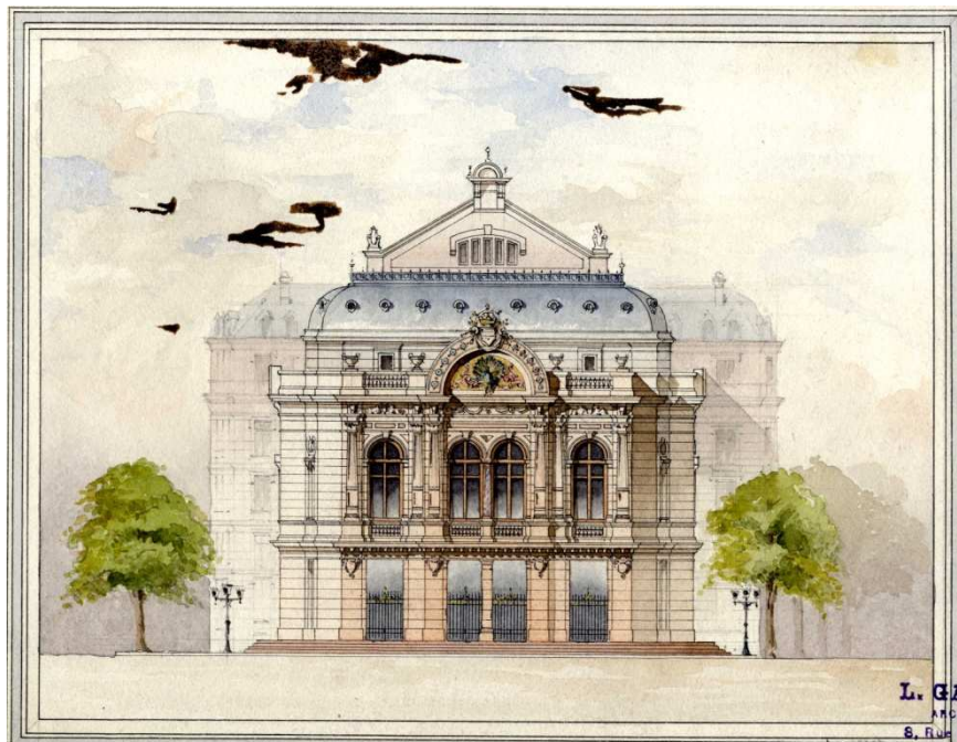
Théâtre municipal de Neuilly-sur-Seine, esquisse de l'architecte Gaillot (1888), Archives municipales de Neuilly-sur-Seine

En 1888, l'architecte Louis Gaillot réalise plusieurs esquisses d'un théâtre municipal de 700 places situé au carrefour des avenues du Roule et Sainte-Foy.