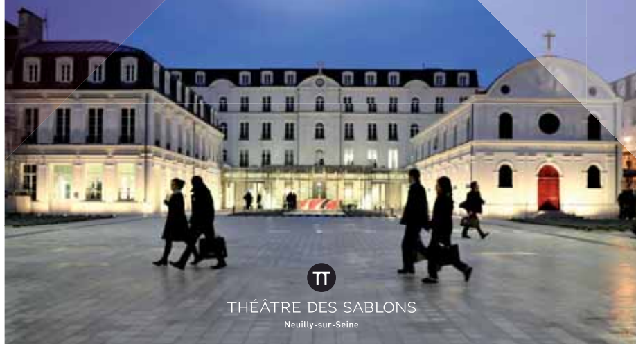
THÉÂTRE DES SABLONS Neuilly-sur-Seine

Animations musicales Visites guidées Ateliers de peinture et de maquillage pour les enfants