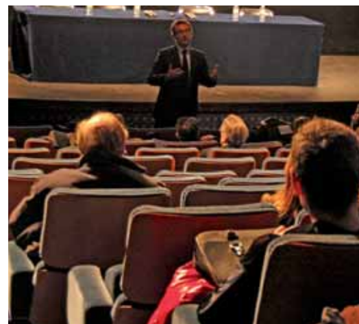
Le Maire reçoit les commerçants.

Le courant électrique est transporté du lieu de production au secteur de distribution en très haute tension, 225 000 volts. Le réseau de transport aboutit dans des postes « source » qui transforment la tension du courant en 20 000 volts et le délivrent à un réseau de distribution via des postes situés dans les quartiers. Ces postes transforment la tension de 20 000 volts en 230 volts à destination du réseau qui alimente les particuliers, les entreprises, etc. Cette structuration est faite pour éviter de trop grandes pertes de courant dans la distribution. En effet, plus la tension est élevée plus le courant peut être transporté sur de longues distances sans perte notable.