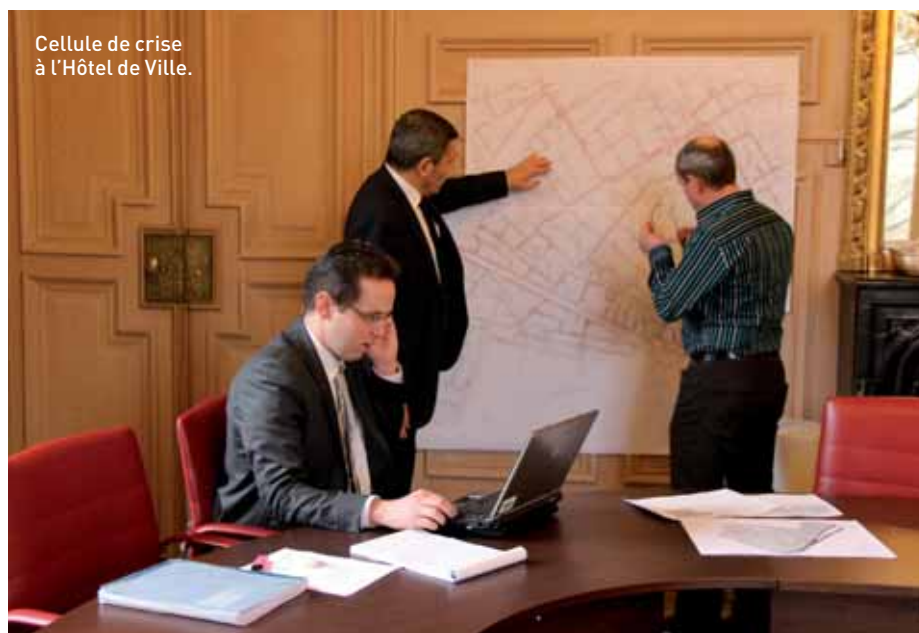
Cellule de crise à l'Hôtel de Ville.