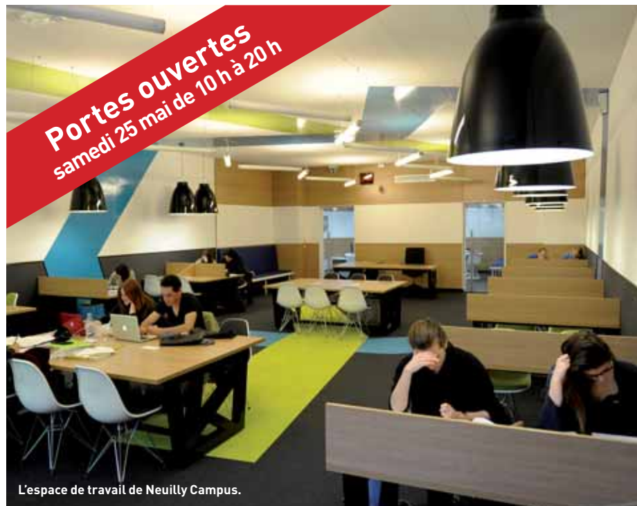
L'espace de travail de Neully Campus.

Depuis le 2 avril, les jeunes de la Ville, lycéens de première et terminale et étudiants, peuvent accéder à un espace de travail et de conseils sur l'orientation et les perspectives professionnelles, créé pour eux.