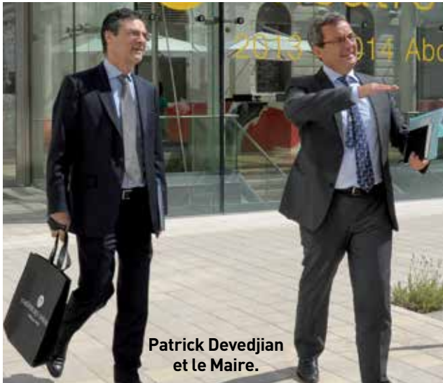
Patrick Devedjian et le Maire.

Ces échanges ont permis d'aborder des dossiers importants comme la contractualisation entre le Département et la Ville, les aménagements de sécurisation du boulevard Bineau, les travaux d'aménagement du parc Saint-James et l'avenir de la Folie, le financement du logement social ou bien encore le réaménagement des Berges de Seine. Patrick Devedjian a également visité le nouveau pôle culturel des Sablons, et notamment le théâtre, l'auditorium et la salle d'expositions.