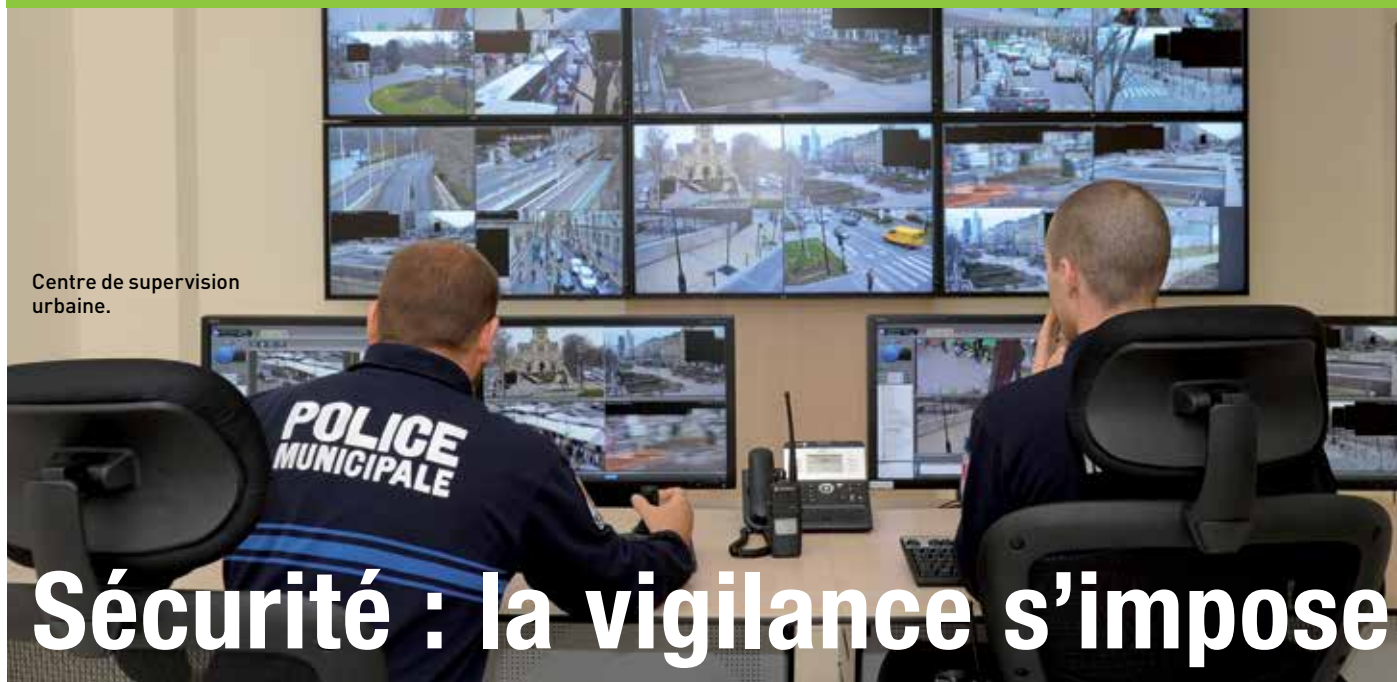
Centre de supervision urbaine.