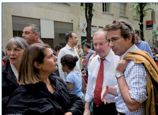
Visite de la brocante de Bagatelle.