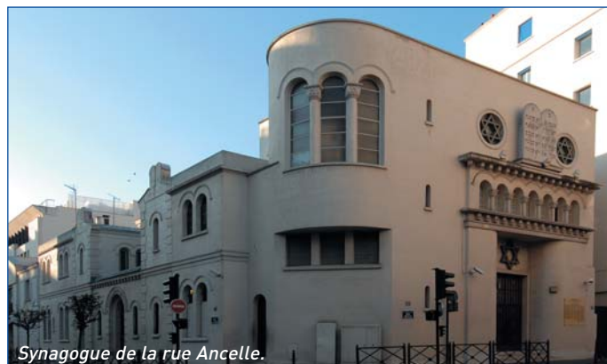
Synagogue de la rue Ancelle.

Je prendrai la parole avant la conférence inaugurale sur le thème « Judaïsme vécu et judaïsme de l'étude » au théâtre du Chézy le 19 novembre et accueillerai avec plaisir dans les salons de la Mairie une passionnante exposition sur « Les juifs de France, 2000 ans d'histoire ».