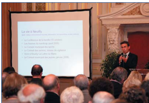
Réunion des "talents" à l'Hôtel de Ville