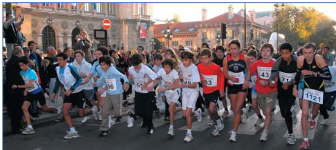
Place de la mairie.

La Course pédestre de Neuilly s'est déroulée le 19 octobre, sous le soleil, autour d'un nouveau parcours de 10 km dans les rues de Neuilly. Plus de 1.200 sportifs étaient au rendez-vous. Plusieurs départs ont été donnés, dès 9h pour les plus jeunes et à 10h pour les adultes. Patrick Poivre d'Arvor, qui habite à Neuilly, a participé à la course... et à la remise des prix. ■