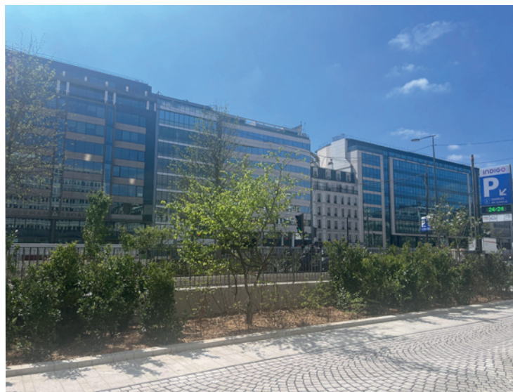
Section Louis Philippe-Hôtel de Ville