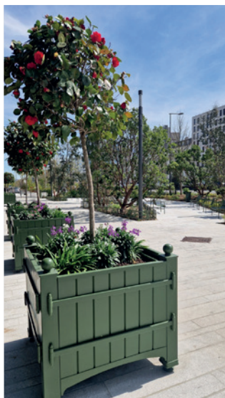
Nouvelle place angle Charles de Gaulle-Huissiers