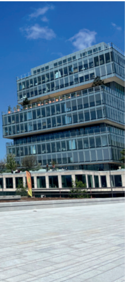
Dalle – ancien théâtre d'eau