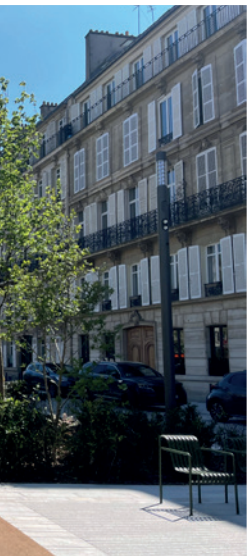
Section Porte Maillot – Paul Déroulède

Tout comme sur la section Huissiers-Église, une aire de stationnement réservée aux livraisons en deux-roues a été créée à proximité de l'aire piétonne.