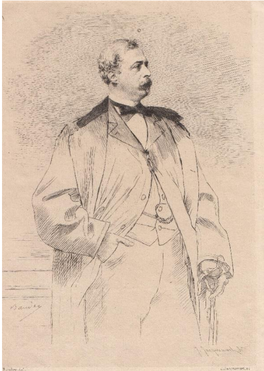
Richard Wallace (1818-1890)

Richard Wallace est né à Londres le 26 juillet 1818. Fils de Lord Richard Seymour Conway, quatrième marquis d'Hertford, il réside une grande partie de sa vie en France, pays qu'il affectionne, et notamment à Neuilly.