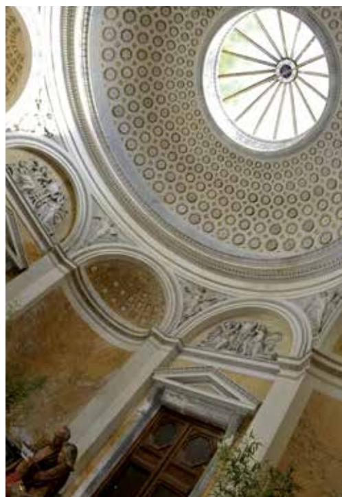
Le pavillon de Musique, 5 rue Henrion Bertier, fait actuellement l'objet d'une étude sur un projet de rénovation.