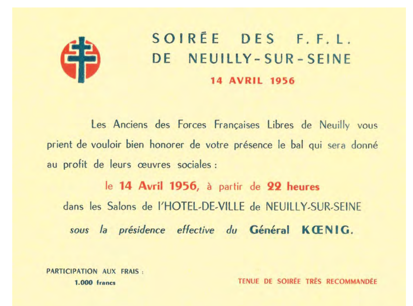
Carton d'invitation à la soirée des FFL - 1956 A.M.N.S.S., 1222 R