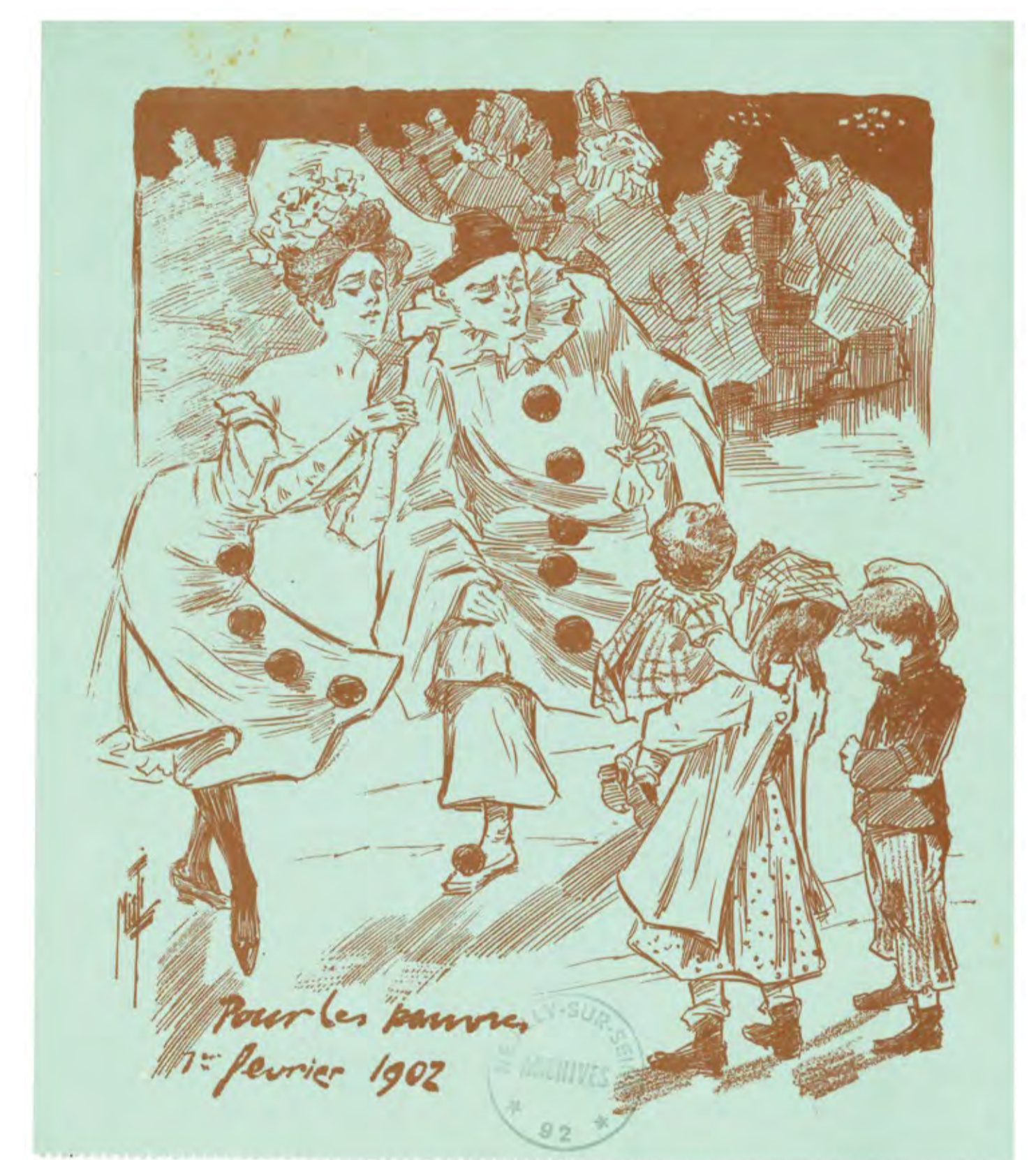
Carte d'invitation du bal pour les pauvres -1902 A.M.N.S.S., 666 V